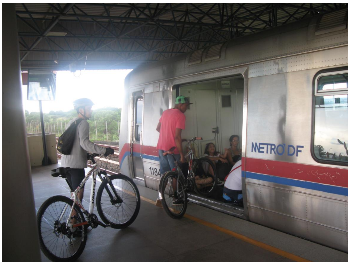
Foto: Embarque de bicicletas no Metrô do Distrito Federal.

Os municípios devem planejar e executar a política de mobilidade urbana. Nos locais em que os serviços têm caráter metropolitano, os Estados ou um consórcio de municípios devem planejar a integração dos modos de transporte e serviços. Para isso, devem elaborar conjuntamente estudos e planos integrados de mobilidade urbana.